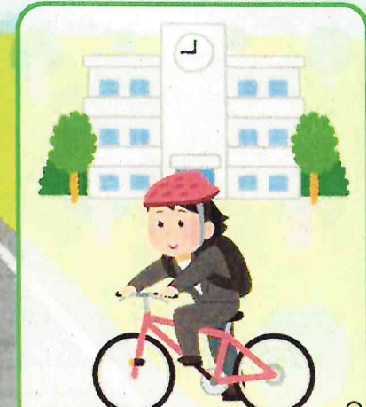
仕事に行くときも