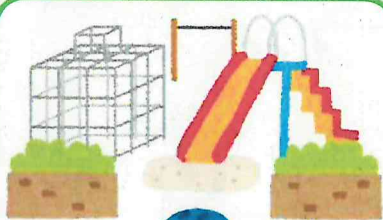
遊びに行くときも